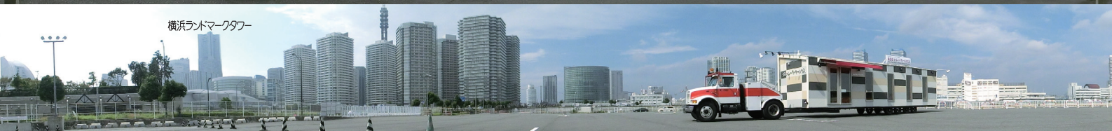
横浜ランドマークタワー