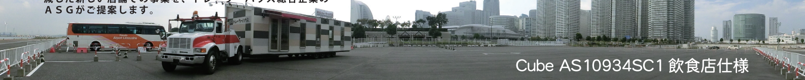
Cube AS10934SC1 飲食店仕様

子供から老人まで、男性から女性まで多くの人の大きな反響 優れたデザイン性・移動可能・売買可能なトレーラーハウス ECOでコストパフォーマンスに優れ、事業継続リスクを低 減した新しい店舗での事業を、トレーラーハウス総合企業の ASGがご提案します。